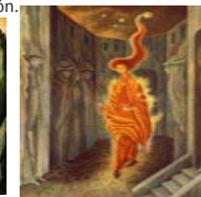
Remedios Varo, El vuelo , 1961 Remedios Varo, La llamada , 1961